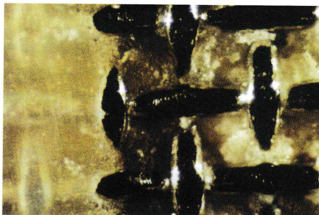
FIGURA 2. Modo de fallo predominantemente cohesivo.

Los tipos de fallo predominantemente cohesivo y predominantemente adhesivo se definen cuando, existiendo una combinación de los anteriores, el otro tipo de fallo está presente en una pequeña parte de la base del bracket.