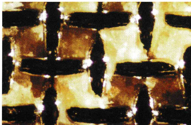
FIGURA 1. Modo de fallo cohesivo

Cinco pares (X, Y) de valores se eligieron del segmento recto de cada curva. Se calculó la regresión lineal por el método de los mínimos cuadrados la pendiente y el coeficiente de correlación. Una vez calculados los parámetros de regresión, se compararon ambas poblaciones mediante el test t de student de comparación de 2 pendientes para establecer si pertenecían a la misma población de puntos.