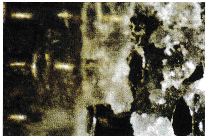
FIGURA 4. Modo de fallo predominantemente adhesivo

Por otra la desventaja de la menor resistencia a la tensión de los brackets adheridos mediante el "grabado" con láser puede minimizarse si pensamos en su uso para pacientes de ortodoncia adultos, en los que necesitamos aplicar fuerzas ligeras, ya que éstas sí las resisten sin desprenderse los brackets adheridos a esmalte tratado con láser.