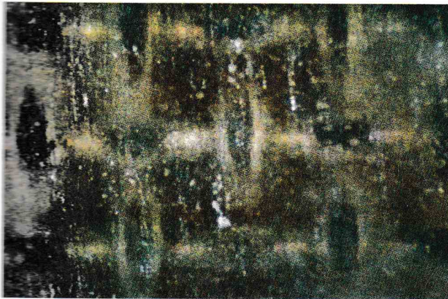
FIGURA 3. Modo de fallo adhesivo

en este grupo es un fallo adhesivo en la interfase esmalte-resina. Todo lo anterior implica que hay un modo diferente de fallo de unión para el método de adhesión con láser y el tradicional de grabado ácido.